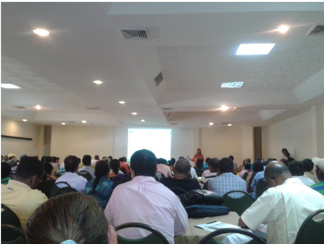
Sesiones tutoriales presenciales en el Hotel Bostón Salón Kalamarí 1 y 2 en Sincelejo