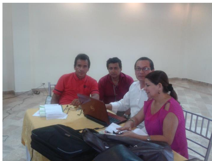
Equipo líder desarrollando actividades en el curso de capacitación escuelas de familias (Septiembre 2014)